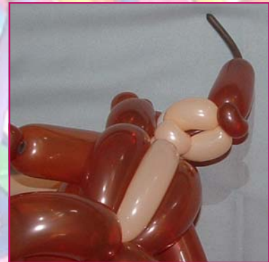
21. "Pinch twist" pour le museau à tourner autour du museau pour le coincer.