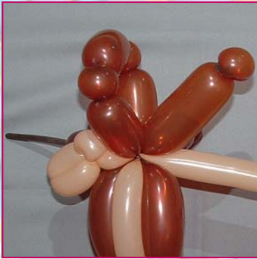
16. Une autre petite bulle à torsader à la base de la tête (vous pouvez le faire !)