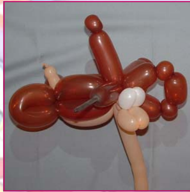
17. On ajoute les yeux en face du "pinch twist" sur le blush".