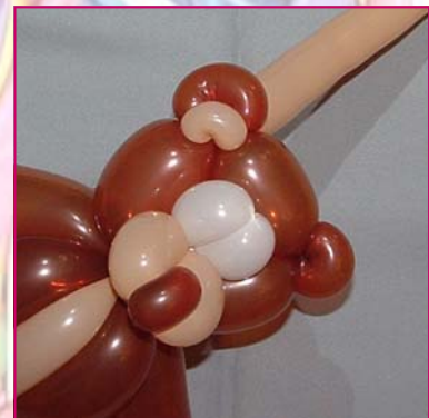
24. Tout petit "pinch twist" à placer devant l'oreille pour faire l' "intérieur".