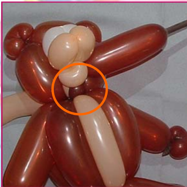
19. Sur le marron, petit bulle à torsader sur le "pinch twist" bluch.