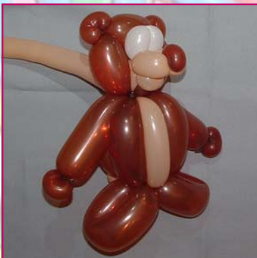
22. Maintenant, on peut couper le marron (l'idéal serait de ne pas couper et finir ici !)