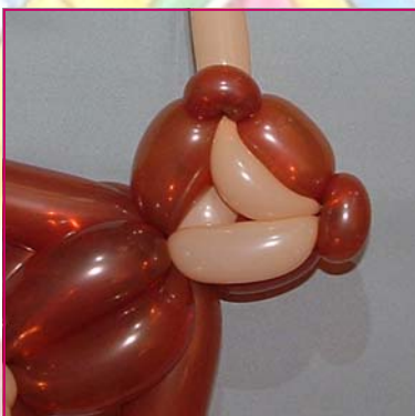
25. On poursuit la procédure sur l'autre oreille et on vient à la base de la tête.

On coupe le blush.. Un peu de garniture pour dessiner les yeux... et voilà ! Un ourson "bien rond".