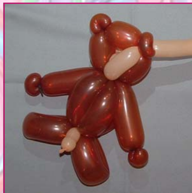
23. Sur le blush, faire une bulle jusqu'à une oreille.