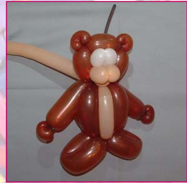
16. Rentrez tout ça dans la tête et torsader les oreilles pour coincer la gueule.